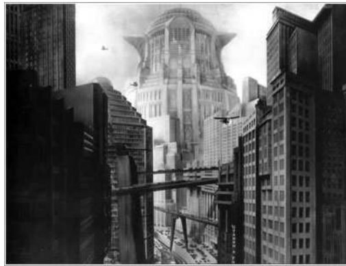
La nueva torre de Babel de Metrópolis, una de las imágenes más conocidas de la película

Aunque con los años ha ido ganando en popularidad y reconocimiento hasta el punto de que es candidata a formar parte del patrimonio de la humanidad de la UNESCO en su apartado de la Memoria del Mundo, cuando en enero de 1927 se hicieron algunos pasajes previos de la película Metrópolis de Fritz Lang y Thea von Harbou esta no tuvo un éxito precisamente arrollador.